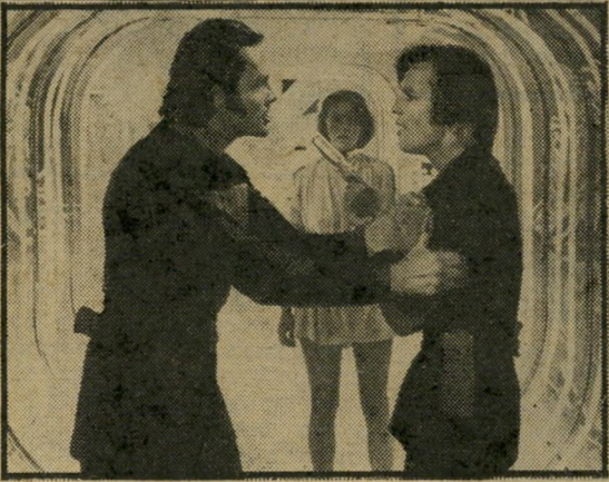
מייקל יורק וריצ'רד ג'ורדן: הקצינים

הבריחה לחיים היא בריחתם של שניים, הוא והיא, המצליחים לפלס דרכם אל מחוץ לכיפה האטומה ומגלים עולם ירוק, יפה וטיבעי. בין חורבות וושינגטון, המכו-סות צמחייה ירוקה וסמיכה מתגורר ישיש בודד שהוא שארית הפליטה מעולם האתמול. השניים מביאים אותו עימם בחורה, כדי להראות לכל החוסים בצל הכיפה הסינתטית שבעצם אין כל סיבה להסתפק רק ב-30 שנות חיים.