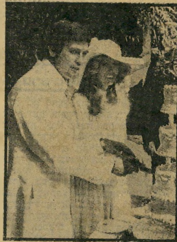
כזה פאוסט וחתן מייג'ורס עכשווי — או לעולם לא!

היא הפופולרית מבין שלושת המלאכים (ממין נקבה) שבסידרה מלאכי צ'ארלי (שתוקרן בקרוב גם בישראל), על מעללי שלוש שוטרות-לשעבר העובדות במישרד-