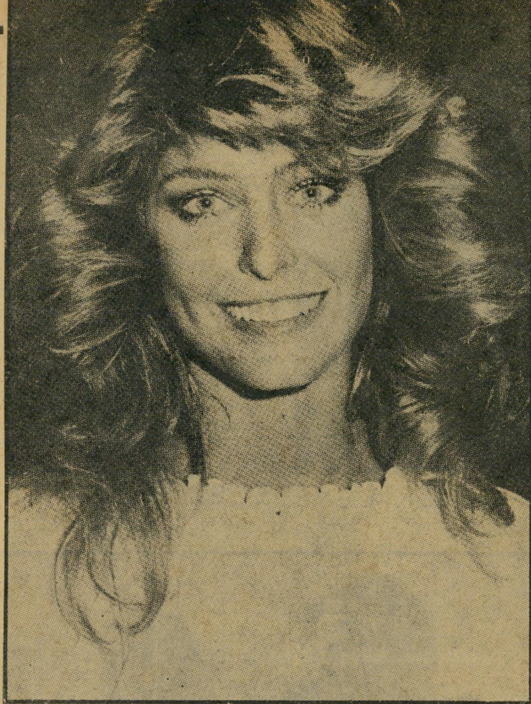
תגנית פרה פאוסטי-מייג'ורס לא מתייחסים ברצינות לנערה יפה!

אותה לקראת ההצלחה המסחררת. כיום היא נאלצת לדהור מבוקר ועד ערב. הסידרה דורשת ממנה לא רק שעות-צילום ממושכות, אלא גם מאמצים גופניים ניכרים (לא-מכבר הושלכה ארצה על-ידי סוס משתולל, ונחבלה קשות). את בעלה היא מספיקה לראות רק בחטף, וזה לא מוצא חן בעיניו. גם העובדה שהסידרה של הגברת מקדימה כיום בהרבה את הסידרה של האדון, במיצעד הפופולריות, אינה מעודדת שלום-בית בבית הווג. אבל בכל-זאת, פרה לפחות שומרת על מידה של הומור. כשנשאלה מתי היא מספיקה לבלות עם בעלה, ענתה: "אתמול, כשהגעתי הביתה, פגשתי אותו יוצא מהמיקלחת. תפסתי אותו, ואמרתי לו: 'זהו זה, עכשיו או לעולם לא!'"