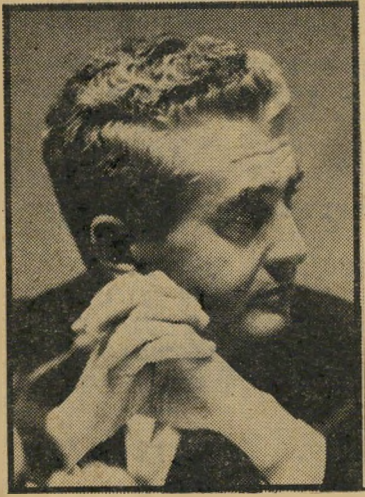
יו"ר יפת משאימתן

שער המניות כיום נע סביב 300 נקודות. השער עלה באחרונה, הן בגלל דלי-