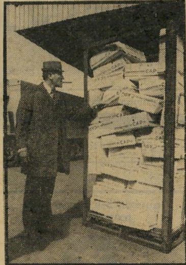
סיטונאי לחוביץ שופרי בשר

במקביל למלאי הבשר, מצטבר עתה מלאי מדיאג של עופות קפואים. מקורות בענף המיספוא מסרו, כי בשבועות האחר-