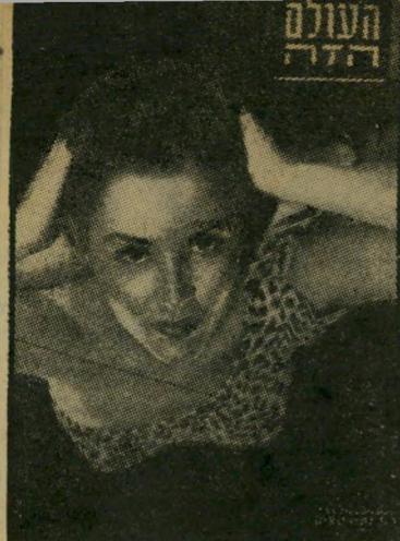
"העולם הזה" 754 תאריך: 3.4.52

הפגיעות הגופניות הרבות הנוספות בחלי קם של הכדורגלנים במישחקי-הליגה, מצד אחד פיתרון: ביטוח הכדורגלנים מפני תאונות בשעת מישחקים ואימונים.