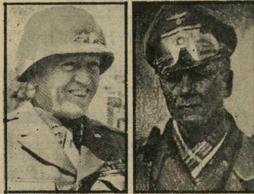
רומד פטיון לשיא הקאריירה — בגיל 60

דבר שני, יש לבטל את ה"הצמדה" בין התפקידים השונים בצבא; ועל כל פנים להחילה באופן מבוקר ובמידה מוערית. אולי הדבר אינו ידוע, אבל בצה"ל שורר ה"דירוג" ממש כמו בשרות הציבורי האזרחי. לפני זמן שמענו כי דרגתם התיקנית של קציני-מטה ראשיים מסוימים בסיקורים המרחיבים הועלתה מסא"ל לאל"מ (שאלה היא, מדוע בכלל מיהרו לבצע העלאה זו דווקא כעת שטימטום ה"שלכת" של האריכיופורים כבר ליבה את אש אינפלציית-הדרגות ללא-גשוא; והרי