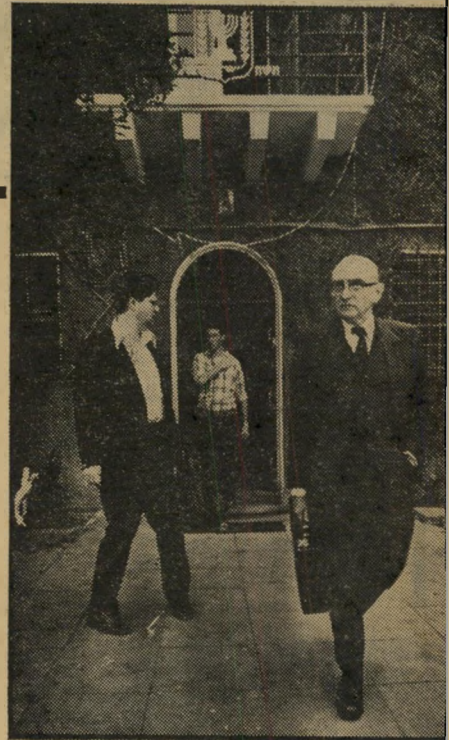
האיוולת יוצא משיבת הממשלה* להפעיל את הצבא

אולם עונת הבחירות היא גם עונת חוסר-המחשבה. מי שרואה לנגד עיניו אלפי עצי-קול, שוב אינו מסוגל לראות את היער הלאומי.