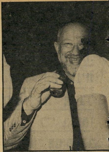
זדה של הסופר דן בן-אמוץ, היתה אחת הדמויות בפתיחה של פרדריקה. בניגוד לנשים האחרות שטריון ובמכניס-גינס. איש-הפירסום דובז'ה, וקא דן תופס תמיד את הילדות הכי יפות."