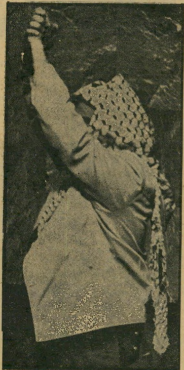
יאסר עראפאת מזימה שחורה