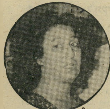
ח"כ גאולה כהן