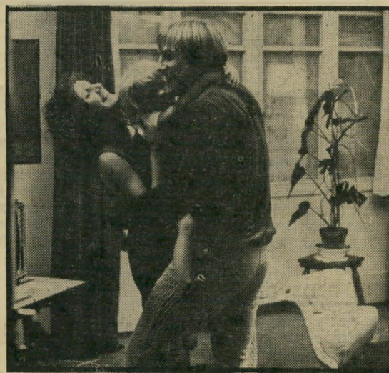
לאוריה ודפארדיה — כך גונבים

כל זה טוב, יפה, והולם בהתאם את הצד המוצלח ביותר של האסכולה השווייצית החדשה, שגורטה הוא אחת הדמויות הבולטות בה. מאידך, סרט זה הוא קו-פרודוקציה, ואולי זהו הגורם למחלולי. הוא מספר על צעיר שנאלץ ליטול עליו הנחלת מיפעל-הרהיטים המשפחתי, אחרי שאביו שותק בעיקבות התקף-לב. כשמסתבר לו שאיש אינו חפץ בהיטי המיפעל הופך הצעיר גנב, כשהכסף הגנוב משמש לו לתשלום משכורתיהם של הפועלים הנאמנים. צרתו של הסרט, שהוא אינו מנתח מצבים, אלא מכריז הכרזות שעליהן הוא חוזר שוב ושוב, למרות שהן ברורות בהחלט עוד לפני שנאמרו. למשל: הבורגנות הקטנה נמנעת תחת הקפיטליזם הבינלאומי (איך ומה בדיוק קורה לגיבורי הסרט, זאת אין טורחים לפרט). החברה מאלצת את האדם להפוך גנב (מדוע אין מוצא אחר, אין מסבירים); הבורגני המצוי מעז לספר להאובתו דברים שהם מלחזקר בפני האשה, למרות שיש דימיון די גדול בין השתיים. לכותו של הסרט יש לזקוף דוקא את ציור הרקע הרגיש והאמיתי של עירת-שדה שווייצית, את האהבה