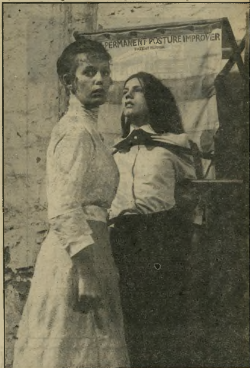
מורה חניכה שקיבחה עונש ב„פיקניק” סערה פנימית במעטה חיצוניות המורה

האווירה הוויקטוריאנית של תחילת ה־ מאה (המיקרה שעליו נסב הסרט אירע ב־ 1900), קצב־החיים דאז, האקלים האוסטר־ לי, מיבנה המעמדות החברתיים, החוש־