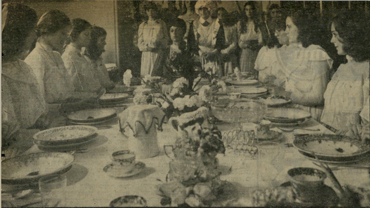
ארוחת־בוקר בפנימיה לבנות בסרט „פיקניק בצלע ההר” אווירה ויקטוריאנית של תחילת המאה

בגיד ההתבגרות. מאז עברו כבר כמה שנים והסרטים האוסטרליים, שהיו במשך תקופה ארוכה מיצרך לשוק הפנימי בלבד, החלו שואפים לראות מרחבים, כמה מן הנסיונות הפסודו־פורנוגרפיים שלהם זכו אפילו בהצלחה מיסחרית מסויימת, ובצידם צמחו והלכו כמה יוצרים רצי־ ניים, כפסטיבל־הסרטים האחרון בקאן, הי־ וו סירטיהם של האוסטרלים מקור־התעני־ יינות ניכר, כשהם יורשים מבחינה זו את הקנאדים והאיראנים, שהקדימו אותם. (ל־