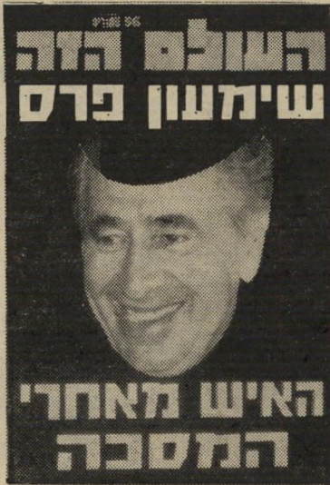
העולם הזה 2059