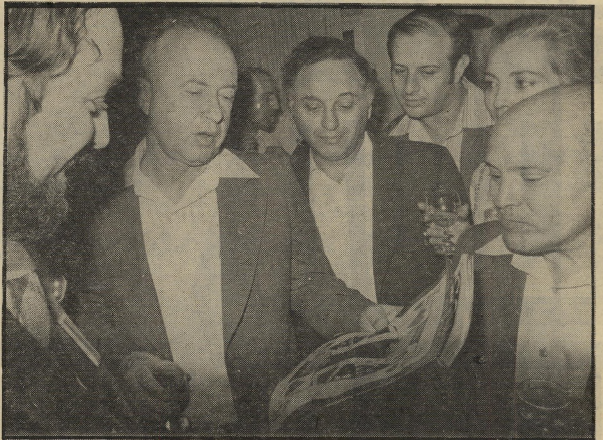
רבין מתבונן בשער "העולם הזה" דקות מופר אחרי בחירתו הימור על כל הקופה

גם אם קראת את הכתבה לפני שנפלה ההכרעה, או מייד לאחריה, הייתי מציע לך לבצע תרגיל קטן בעיתונות ולקרוא את אותה כתבה שנית, עתה. אני סבור שתופתע, כמוני כשקראתי אותה שוב. היא נקראת כאילו נכתבה אחרי שכבר היה ברור לכל כי יצחק רבין נבחר כמועמד מיפולגת העבודה לראשות-הממשלה. יש בה ניתוח של סיבות נצחוני של רבין ור היא שקולה ומפוכחת יותר מכמה מאמרי-סיכום אחרים שנכתבו אחרי הוועידה. העולם הזה יכול היה להסתכן בפירסום שער וכתבה מעין אלה מראש לא רק בשל המידע האובייקטיבי שזרם אליו משני ה-מתנות. הערכת-המצב העיתונאית מסתמכת לעיתים קרובות במידה לא מבוטלת על צירוף של מידע, ניתוח מפורט של העובדות וגם אינטואיציה. במקרה המסויים הזה לא איכזבו כל אלה.