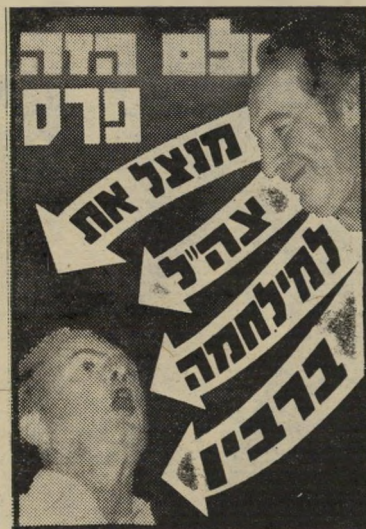
העולם הזה 2058

באולם הגועש של היכל-התרבות, שי אלפי פיות בו הריעו ליצחק רבין, אשר זה עתה נבחר כמועמד מיפולגת העבודה לראשות-הממשלה, פנה אלי אחד הוותיקים בכתיב המיפולגות בארץ, "ניצחתם!" טפה על כתפי, "רבין חייב לכם תודה!" כמה שעות קודם לכן, עוד בטרם נפלה ההכרעה הדרמתית, פגשתי במסדרונות היכל-התרבות ידי, ישנמנה עם ראשי מחיר של שימעון פרס. הוא עמד מוקף חברי רת אנשים, שרוי בעיצומו של ויכוח לוהט, כשהוא מנסה לשכנע, להשפיע ולרי כוש לבבות. כשהבחין כי הטיח לעברי בר מידה רבה של טינה ומרירות: "תודה רבה לכם! יופי שעזרתם לנו!" והטון הסאטירי קסטי של הדברים, שנאמרו בלשון סגיי נהור, היהודי למרחקים. לא היו אלה תגובות יוצאות-דופן. במהיר לך ועידת מיפולגת העבודה ואחריה נתקלתי לא אחת בהתייחסות אל העולם הזה כאל גורם פעיל בהתמודדות שריתקה את כל המדינה. היו לכך ודאי סיבות טובות. שכן, דומני שהעולם הזה היה הפעם העירי תון היחיד במדינה, שנקט עמדה ברורה וחד-משמעית למען בחירתו של מועמד