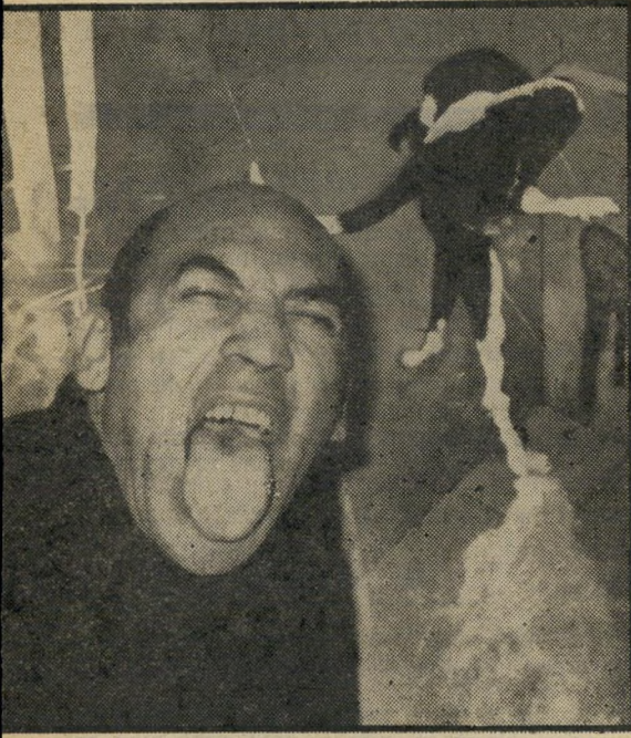
„הספרדי, למשל, הוא אדם סימפטי“