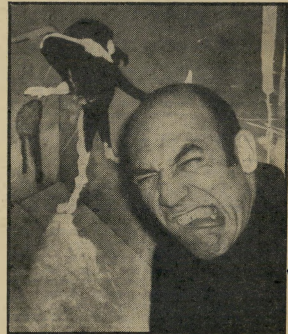
„אפילו הכובות שעשיתי, היו אלימות“

אני מעדיף את הארצות הסימפטיות. בצרפת — לא סימפטי. אנגליה — זה לא סימפטי. הולנד — גם לא סימפטי, או שהיא סימפטית בחינוך. הספרדי, למשל, הוא סימפטי. אתה לא צריך לדבר איתו כל כך הרבה.