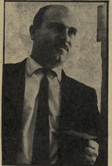
קדוויג' חבר הצוות

סגן ראש-הממשלה, אלון, הביע את הדעה שהשיחות יתקו את אש"ף, ויהפך כן את אש"ף שותף יעיל יותר בדרך לשלום. בעוד שיריבו העיקרי של רבין במאבק על הנהגת מפלגת-העבודה, שר הביטחון שימעון פרס, טוען כי אחרי שהימשטרים הערביים הרגו את אש"ף, אין