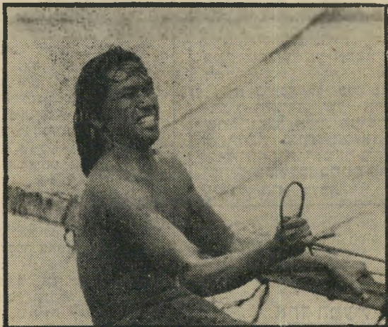
בן פוליניזיה — עץ הלחם והחיים

תוך כך מגיש קויליצ'י צילומים מרהיבים ביופיים, בין אם מדובר בצילום תתי-ימי (תחום שבו הוא נחשב כאחד המומחים הגדולים בעולם), או בצילומים אוויריים עוצרי-נשימה של הריגוש לפני התפרצות באיי פאפואה. אומנם, חקטעים העלילתיים כביכול, כאשר מאנאי נקלע לידי