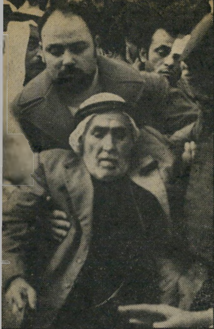
אביו של ראשד בהלווייה * מכל קצוות פלסטין

הפיתרון הכי טוב בשבילי זה להיות רועה. כל מה שאני רוצה זה עשר עוים.