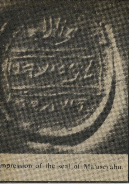
Impression of the seal of Ma'aseyahu.

ישראל ועתיקותיה. בין העורכים. אגב, נמנה גם ייגאל דיין. הספר מכיל מאמר של הארכיאולוג הנודע ז'אן פרו. על גלוסקמאות וארזונות-קבורה מבני-שמן (עמוד 46). פרו כותב כי מימצאים אלה מן התקופה הכלכלית הם העתיקים ביותר בעולם. במאמרו הוא מודה, "למר משה דיין שנתן לי רשות לסייר ולצלם את הפריטים שהוא אסף ושיחזר, בסבלנות רבה, וכן את הערותיו שרשם בזמן שגילה את המימצאים. אני מודה למר אברהם בירן מנהל אגף-העתיקות שנתן לי את התקן של המימצאים בבני-שמן. לשניהם אני מודה."