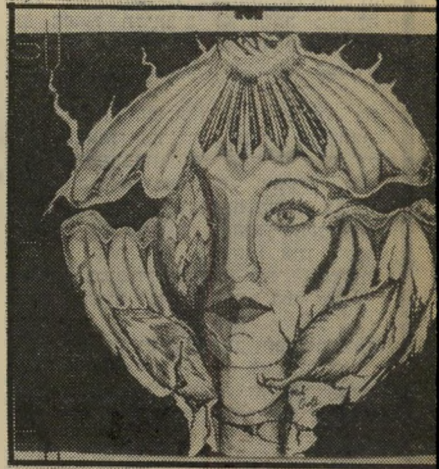
פרפרים בראש כשהיא מצוירת בעלי אנטים דמויי פרפרים (למעלה), ופרפרים בעלי אישיות משלהם, למלי יש