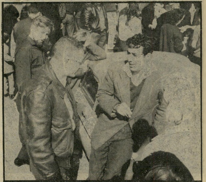
1965: עם עברון ואבנר בהכנה נגד הפקעת אדמות