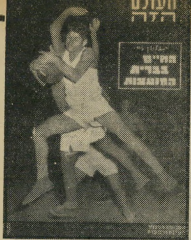
"העולם הזה" 744 תאריך: 31.1.52

נה אחת נוספת, ולהשאיר את החלטתם הסופית למועד מאוחר יותר.