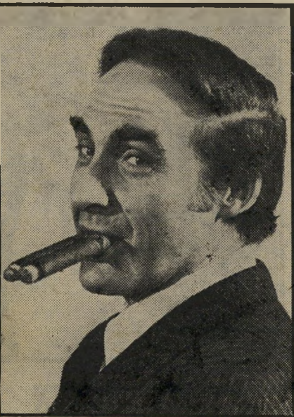
סיד סיוור — המפיק האמיתי נכנע לפיתוי

שפירושו פשיטת-רגל, שפירושו קנייה כדאית לחברה, ובכן, אולי אין זה התיאור המפורט והמדויק ביותר של המצב שבו היתה נתונה חברת פוקס המאה-העשרים בתחילת השנה שעברה, אולם עובדה היא שסירטו של ברוקס היה בעצם זה שהוציא אותה מבזק כלכלי עמוק מאד (יחד עם סרט אחר, משעשע פחות, בשם אות משמיים). עובדה היא שברוקס עשה ב"אמת ובתמים סרט אילם, והוא אכן השיג כמה מן הכוכבים הגדולים ביותר של הוליווד, לתפקידי-אורח לפחות. ברט רייט נולדס מכתב בפארווידיה מבריקה על עצי מו ועל פולחן ההערצה-העצמית של הכוכב הגברי שבאופנה; לייזה מינלי נאב-