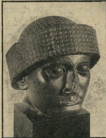
"ראש גודיאה" המזוייף — למה לחפש בחוץ?

(1969). אך לא רק אביגד כתב באותה חוברת דברים על אבן-המישקל. גם עורך קדמוניות הקדים לפירסום דברים, שבהם