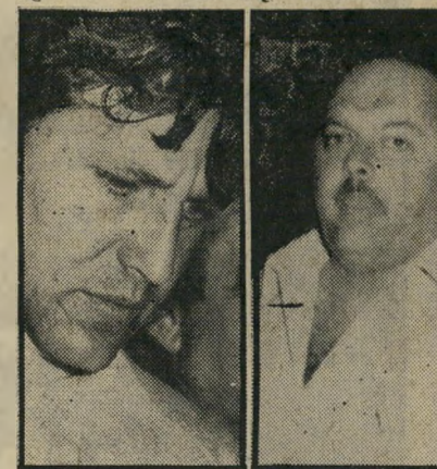
קוד בעד — עוז נגד

התקציב קוצץ. אלא שבינתיים, שוב התלקח הוויכוח הציבורי הישן, בשאלה