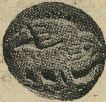
אבן-המישקל המזוייפת אם יש בארץ —

מה שידן שכה לציין הוא שפירסום תגלית אבן-המישקל נעשה על-ידי אביגד בירחון קדמוניות (שנה ב', חוברת מס' 2,