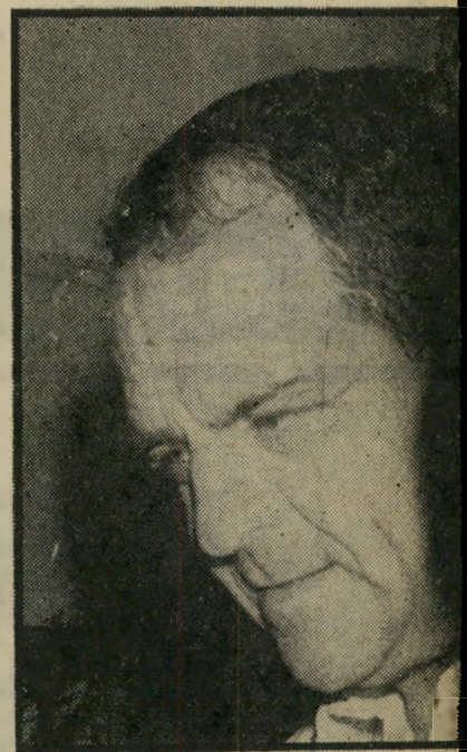
יועץ-לשעבר חלפון רבין צריך לותר לפרס!

למרות שהצהרות קיצוניות משני עברי הגבול עלולות היו ליצור את הרושם כי עומדת לפרוץ מלחמה חדשה, המשברים בתוך מיפלגת השילטון במדינה ניראו חמורים יותר.