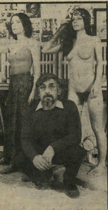
במאי ז'יר קארל הבובה והאשה

פחות מסיבתה. אך אין איש מכל שעזרה להם המוכן או מסוגל להשיב לה כגמולה. האשה בחברה. מבקרים שמרניים יציגו בוודאי, ובצדק, שהסרט הוא בליל של סגנונות. לצד מיבצעים אקרובטיים של מצלמה והמצאות מקוריות של בימוי יש בו שימוש נפוץ בהעלולים הפשוטים ביותר של הקולנוע המיסחרי (למשל, כשי נורמנד מוציאה את אמא מביתה החולים). ויש באנאליות די שיגרתית בחלק מן הי דמויות.