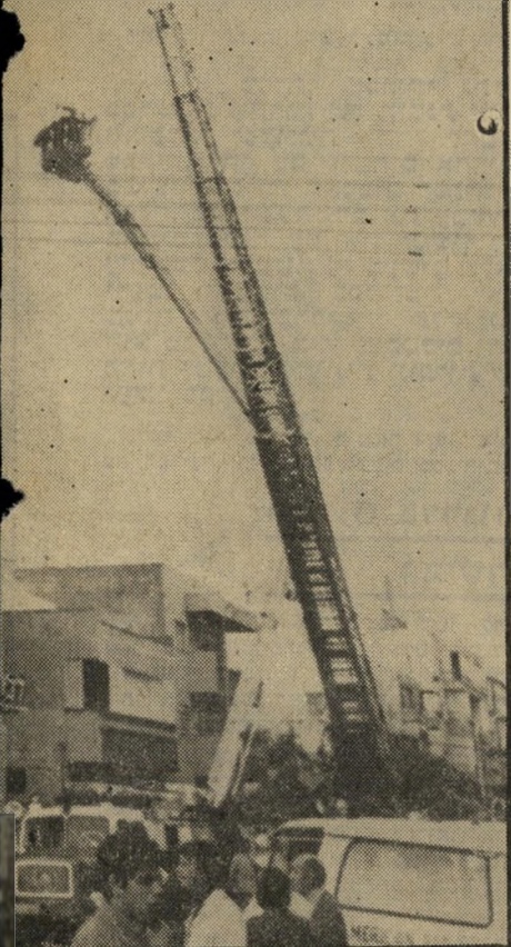
מלון "דבורה" בתל-א"ב

עד שעלה באש, הלך שמו של מלון "דבורה" בתל-אביב לפניו כמלון חרדי, בשר למחרת. זו אולי הסיבה שהיו כאלה שטענו: "זה לא מלון — זה בית-כנסת עם מיטות." השבוע הפך המקום לבית-כנסת כלי מיטות. חלק ניכר מהמיטות עלו באש. אבל את ספרי התורה הספיקו להציל בעוד מועד. וגם את הכלבים של אורחי המלון. הירייה על השריפה במגדל הלוהט במרכז תל-אביב, פשטה כמו אש ברחובות עיר גדולה. כל מי שרק הצליח לתפוס מצלמה