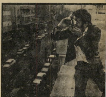
מראה מעל גג השכן