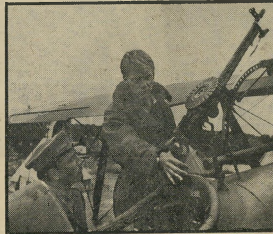
פלאמר ומקדואל — המילחמה איננה ספורט

הדיפון מג'מאיקה. אומנם, טען, "אני יכול לומר בכנות שלא עשיתי מעולם סרט רק בשביל הכסף, ואולי משום כך מצאתי עצמי פעמים רבות כלי-כך ללא פרוטה בכיס." אבל האמונה שנתן בסרטים הניבנה פירות בתדירות נמוכה כלי-כך עד שבסופו של דבר, לפני כמה שנים, החי-ליט פשוט לפרוש. שבע הרפתקות-אהבים