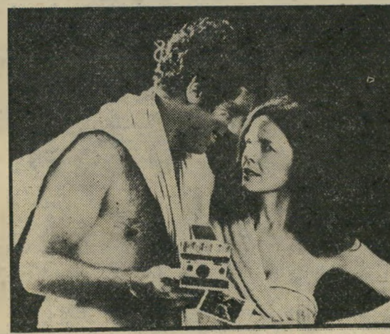
גולד וקייטון: המוסר הכפול

עתה סבורים הכל שלא היה בנמצא מי שיכול היה לעשות את המלאכה כמהו. זוהי המלחמה המלאה הראשונה שלו בי-סרט אמריקאי במאת האחוזים. מועמדותו לאוסקר בטוחה כבר, וכנראה יהיה זה אוסקר לאחר-מוות. הוא היה כה מאושר מן ההצלחה בסתינו חייו, עד שמכר את חווה בג'מאיקה ועבר לבית חדש, בי-שכונת-כוכבים הוליוודית. הוכחה שלפ-עמים מאוחר מכדי להצליח.