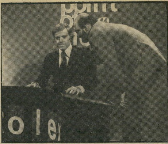
בויל ורדפורד — קנדי, לינדסי וכל השאר

אידיאלים רבים המגולמים, כביכול, בשיטת הבחירות שם, או בצדק האבסולוטי שרבים רואים בבחירות אישיות בכלל. ואם-כי היעילות שבהגשת הנושא פוגמת לאפעס בעומק הדמויות, ההופכות שאבלונות סטנדרטיות של העולם הפוליטי, יש כאן מבט צונן של השיטות שבהן בוחר העולם את מנהיגיו, ויש כאן כמה הברקות אישיות של פיטר בויל ואלן גארפילד, כעורויו של מקיי, הראויות בהחלט לשבח.