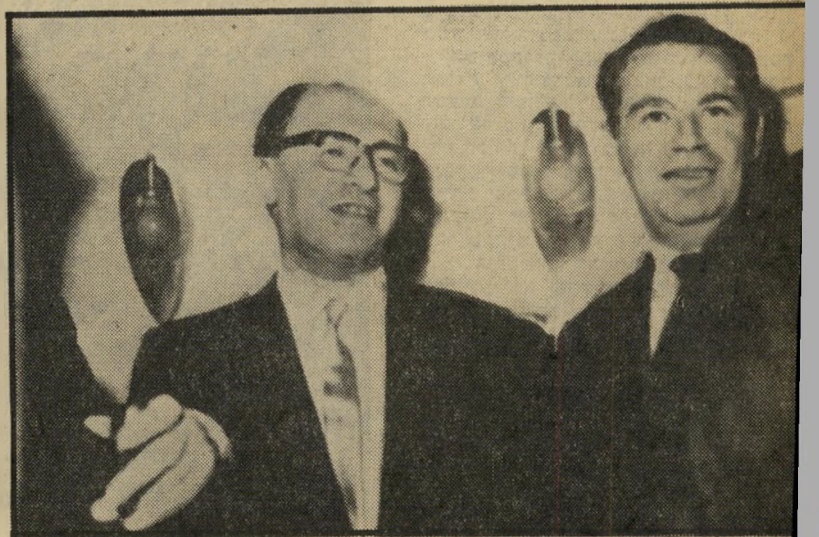
1965: תמיר כנושאי-מליון של מנחם בגין