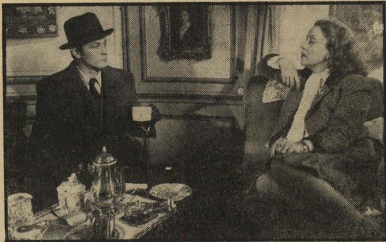
ז'אן מורו כידירתו המיסתורית של מר קליין חסדיה של בעלת-הבית היהודיה

צורנית מפורטת לעבודה, ואם יש דבר אחד שבו אין להטיל ספק, הרי זו השל" מות הצורנית של הסרט. אלא שמעבר ל" צורה קיים התוכן, וכאן אי-אפשר להסת" פק אך ורק בעקרונות אסתטיים וניסיון רב כאן יש צורך גם באתיקה, וזוהי ה" קודה שבה נכשלים כיום כמעט כל אלה שרוצים מאד לעשות סרטים פוליטיים מבלי לעסוק בפוליטיקה.