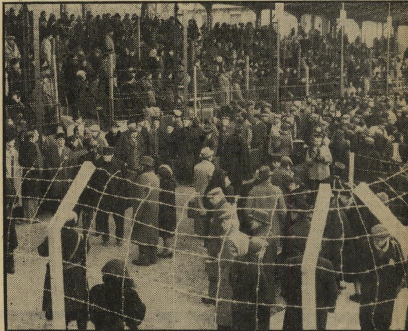
מחנה-האיסוף שני יהודי פאריס כדי להיזכר בסאטניאגו דה צ'ילי