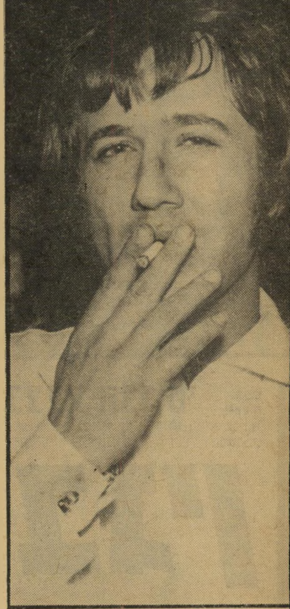
ברדוגו מי שקרא לעצמו בעבר אבי הכרמלי, נעריהו"ה של הבהמה הירושלמית, אוהב חתירי כות מושבע ומגדולים המבליס בבירה.