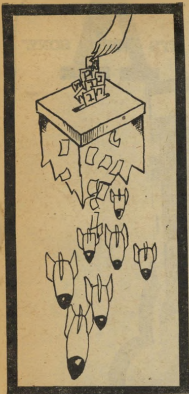
"מכוננת הבחירות" — מה שנכנס —

"העולם הזה" שבועון החדשות הישראלי • המערכת: המונחה: תלי אביב, רחוב גורדון 3, טלפון 03-243386. תאודור 106 • מען מברקי: "עולמפרם" • מורפס ב"הרפוס החדש" בע"מ, תליאביב, רחוב בן אביגדור • הפצה: "גד" בע"מ • גלופות: "צינקוגרפיה כספי" בע"מ • העורך הראשי: אורי אבנרי • המוציא לאור: העולם הזה בע"מ.