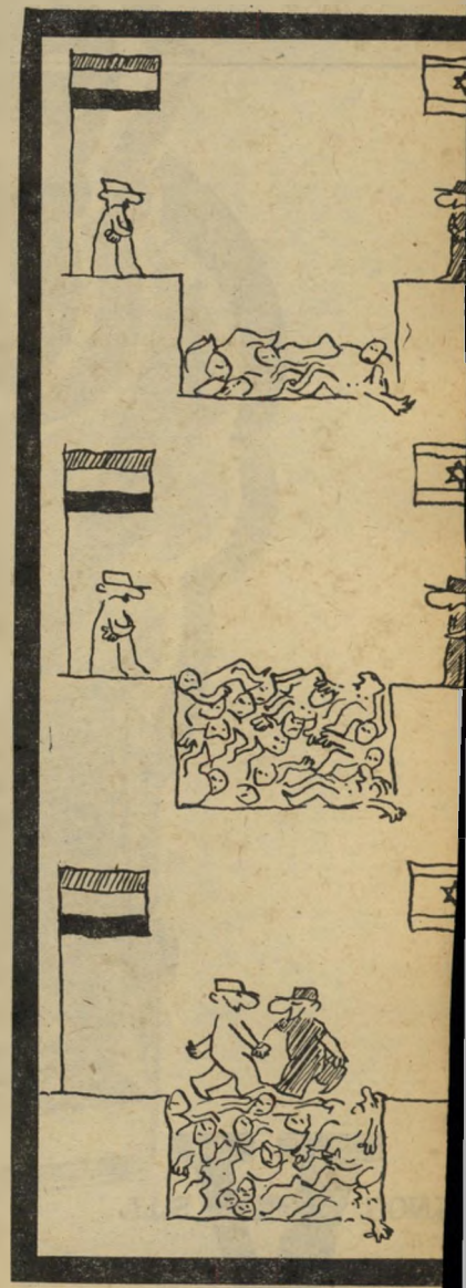
"הפסקת-אש" בסיס לשלום

שם האלבום הוא מישחק-מילים בצרפתית, שפירושו "מה שאנחנו שמים ו" או "איך שהפלקנו זה לזה", על-פי שם של מישחק-ילדים צרפתי