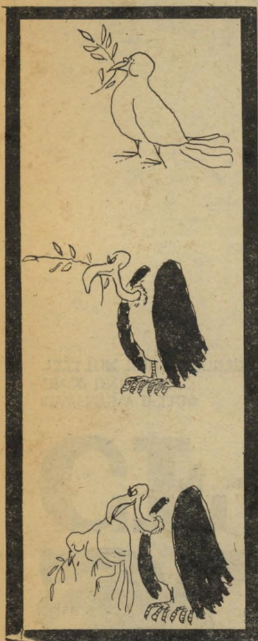
"אלטרנטיבה פוליטית" — ומה שיצא —