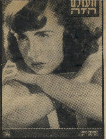
„העולם הזה“ 739 תאריך: 27.12.51