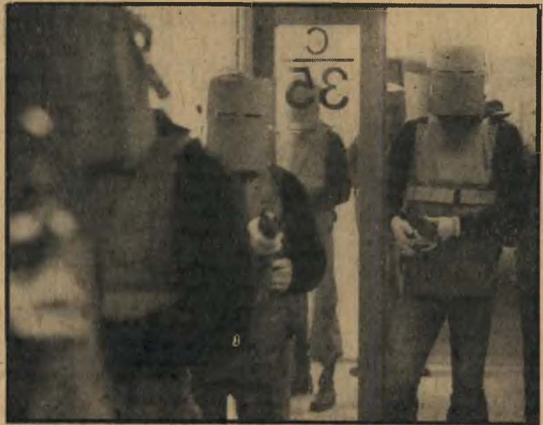
שוטרים באפודות ובכובעי-מגן: נאצים מול נאצים

ב ימים הקרובים יקרו על מסכי הקולנוע ברחבי הארץ סרט נאצי. מובן שלא יהיו בו צלבי-קרוס, פלגותי סער ונאומים של אדולף היטלר. להיפך. הוא גודש סיסמת אנטי-נאציות. כל כותביו ומפיקיו הם אנטי-נאצים מדופלמים. גרמנים מן הסוג הכי טוב. ובכל זאת, סרט נאצי מובהק. נאצי בסיגנונו. נאצי בשיטתו.