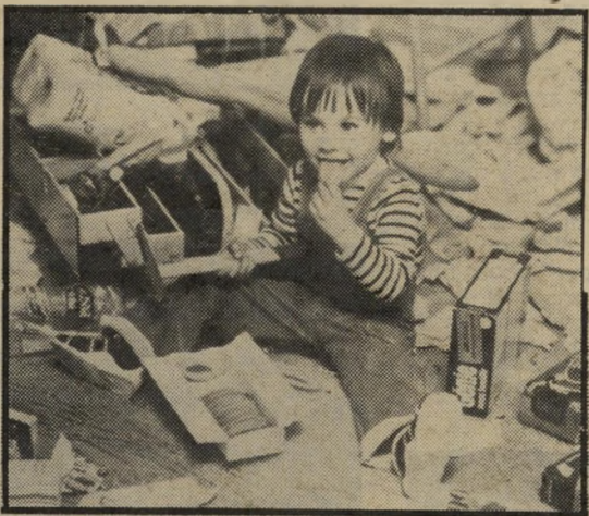
אחד הגיבורים הצעירים של "דמי כיס"

מה שיש לטריפו לומר הוא שהיחס המעוות לילדות, חוסר-האונים, או חוסר-העניין או חוסר הרגישות של ההורים, כולם מותירים את עיקבותיהם על הצאצאים היכים, שלמרות הגיל והגודל הם בעלי רצון משלהם, תשוקות ושאיפות משלהם, והתעלמות מכל אלה גובלת, בסופו של דבר, בעיני טריפו, באפלייה. אהבתו של טריפו לבני-מינו, תכונה נדירה כלי-כך בקול-נוע היום, בולטת בכל תמונה בסרט, וכישרונו לעבוד עם