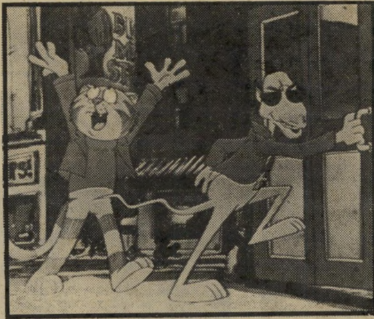
פריץ החתול - מיסגל מצויר

מיקרופונים במקום תשמישי-קדושה. הסיפור הוא בערך כזה: אם מינור ישישה נפטרה, ועל ערשה-הדווי היא מבקשת להבטיח שירשתה תהיה שייכת לפלג השמרני, כמוה. הסכנה הנשי קפת ליורשת הרישמית, אלכסנדרה, באה משני כיוונים. מצד אחד, אחת מסוסות המלחמה הוותיקות של המינור, גרטרוד, היטיבה למשוך בכל החוטים הפוליטיים; מצד שני, גזירה צעירה ששמה פליסטי (בעברית - אושר), הדוגלת בשינויים מרחיקי-לכת במינור ומפעילה חלק מהם עוד לפני שהנהגו רשמית. כך, למשל,