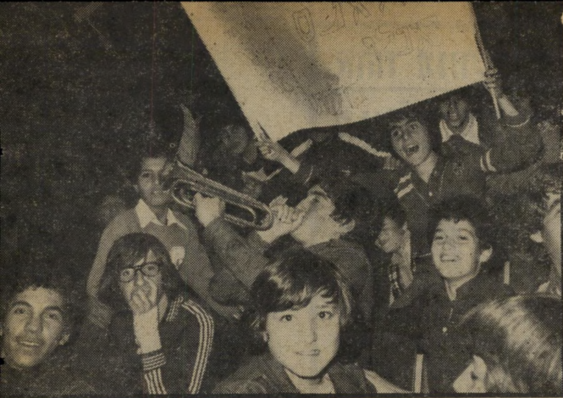
אוהדי „ליידי דייוויס” אוהדי בית הספר התיכון ליידי דייוויס, מקבלים בתרועות ובחצוצרה את שחי קני בית ספרם, שנוצחו במישחק הגמר של הבנים עליידי כדורסלני אליאנס.