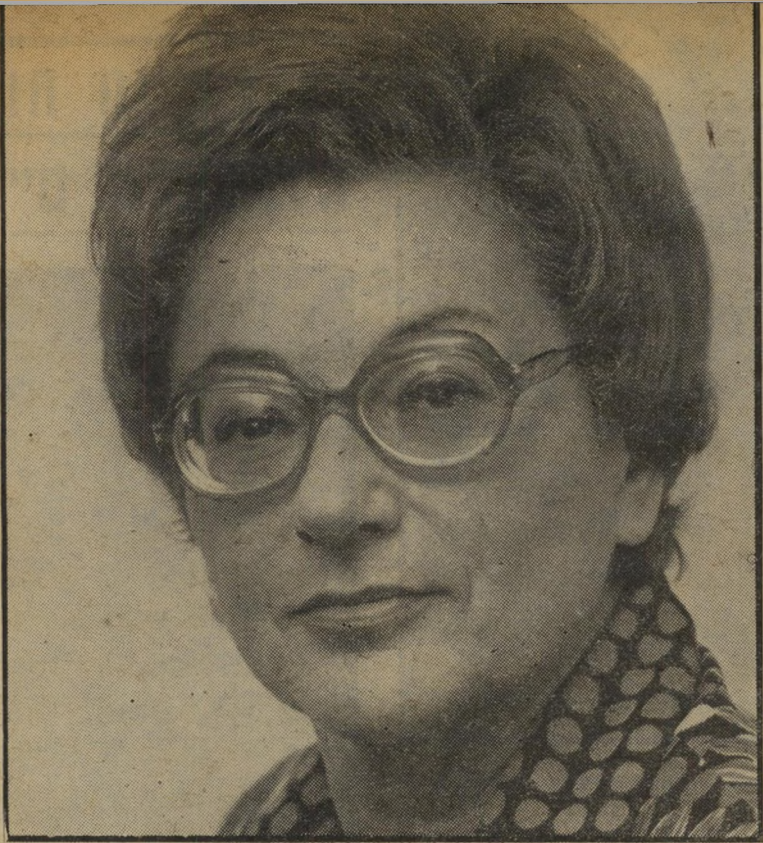
פרקליטת-המחוז: היא תבעה לערוך חקירה