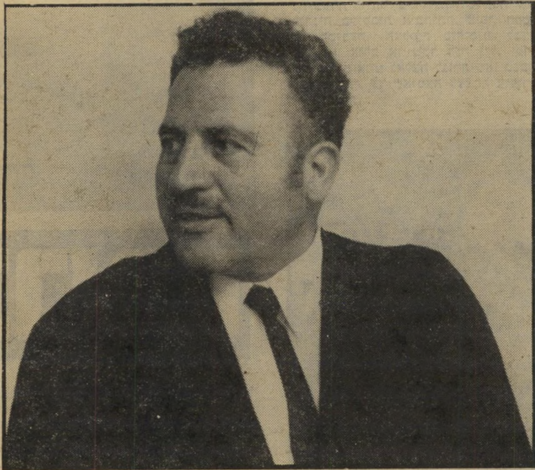
הסניגור: הוא הוכיח שהרס"ל שיקר