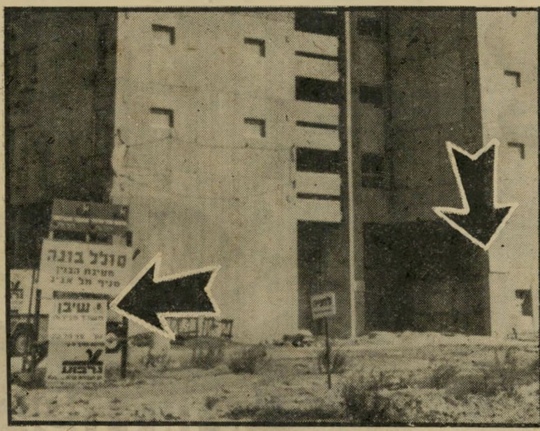
שדטי מישרדי המכירות, "שיכון" על בניין "שיכון עובדים" על ראש הגג —

ההאשמות החריפות שמעלה העולם הזה מדי שבוע נגד אברהם עופר, היו מ' פיקות בכל מדינה אחרת כדי להדיח אדם זה מתפקידו. שכן, מחריד לחשוב שאדם שניהל בצורה כה מושחתת את חברת-השיכון ההסתדרותית, ממונה כיום על מיסרדי-השיכון הממלכתי. עופר, והבי ריו בממשלה, בוחרים בשיטה של התי-עלמות מהאשמות העולם הזה, מתוך תיקוה שהציבור יעבור עליהן לסדרי-היום והן יישכחו. אם אומנם הם סבורים כך, הם טועים טעות מרה. חלפו הימים שבהם יכלו אנשי-ציבור מושחתים לצפצף על דעת-הקהל ולהמשיך במעלליהם, כאי-