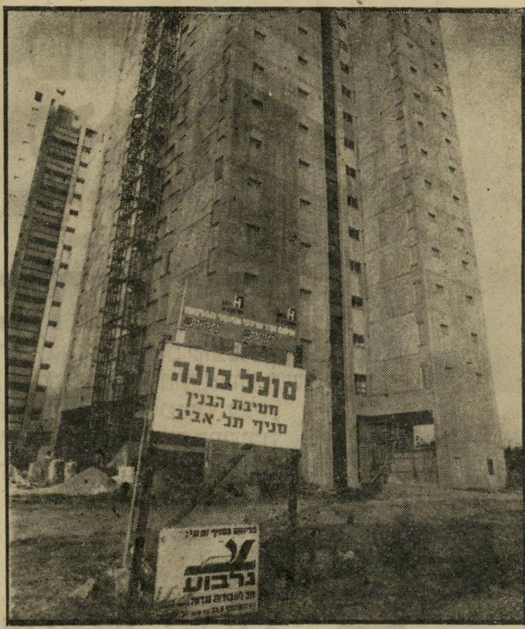
בניין "שיכון עובדים" ללא שדטי "שיכון" שהוסרו בווער השלט

שורת המאמרים המתפרסמת מנה שיי-שה שבועות בעיתון זה והחושפת את מעלליו של שרי-השיכון כיום, אברהם עו-פ'ר, בעת שכיהן כמנכ"ל שיכון-עובדים, מציינת תמונה עגומה מאד לגבי מה שהתחולל בחברת-השיכון הגדולה ביותר