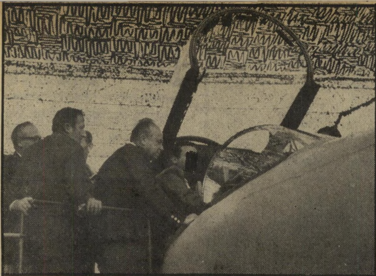
רבין מציין אל תא-הטייס של האפי-15 שר הביטחון אטר