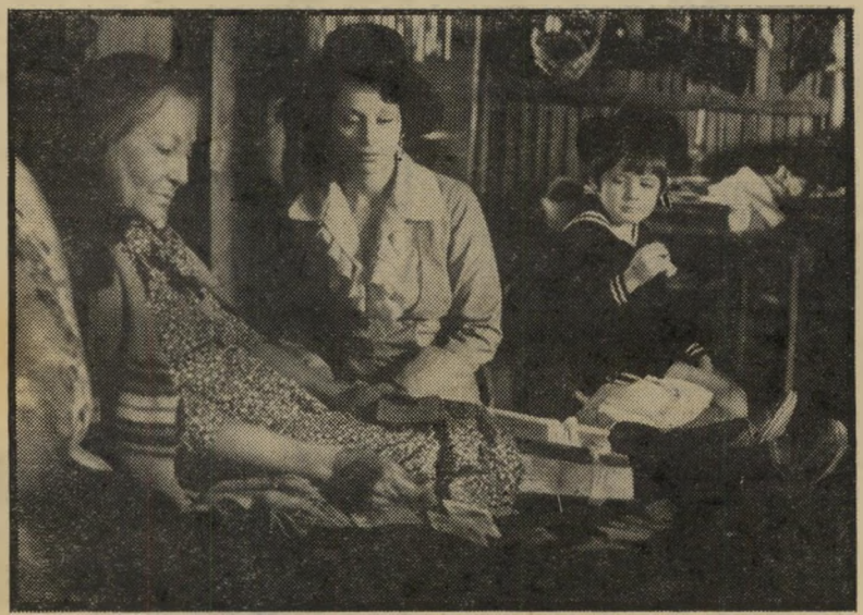
ביקורת חברתית ב"באזון קאני" ביקור הגברת אצל האיכרה האינדיאנית

בהשיגיה בשנים האחרונות. אין ספק, שאחת הסיבות המכריעות ל־אירגון אירוע זה, היתה סיום כהונתו של לואיס אצ'וריה כנשיא מכסיקו, סיום הכורז בחובו, כנראה, גם את החלפת אחיו, רודולפו אצ'וריה, שחקן־לשעבר, שכהן כמנהל תעשיית הקולנוע שם. וככל מי שמגיע לנקודת־תפנית בדרכו, ביקש גם המנהל היוצא להראות את השינויים שי חולל בממלכה שנמסרה לרשותו לפני ששנים. פומבררו וסניוריטות. ואכן, השינויים קיצוניים. התעשייה המכסיקנית, שי היתה בזמנו הפורחת ביותר בכל אמריקה הלאטינית, וסיפקה את צרכי העולם