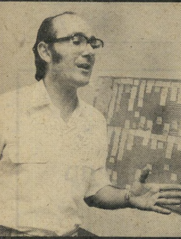
ניצב קרמי חקירה תמונה

פרשת החקירה בעניין עופר מעוררת חשד, כאשר בוחנים מה קרה לארבעה תיקים שנחקרו על-ידי מחלקת-החקירות של זיגל ונמסרו לפרקליטות מחוז תל- אביב להגשת כתבי-אישום. בתיקים אלה נמצא, כי דירות של זוגות צעירים נמ- סרו למי שלא היו זכאים לכך. בתיקים