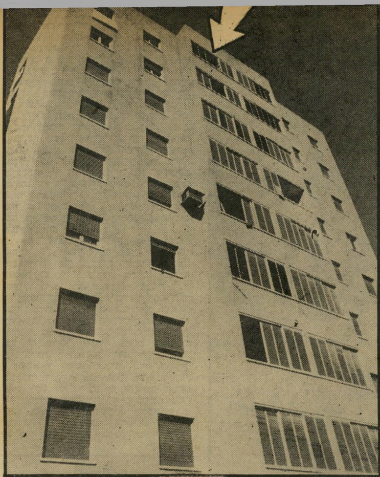
דירתו של רחנייב בקומה השמינית (מוז החץ) מאות מדרגות ברג

התבואות הורעלו עליידי ריטוס מן האוויר, בפקודת המפקד הצבאי, כדי לאלץ את הכפר הערבי למסור חלק מאדמתו להתנולות יהודית, הקרויה גיתית.