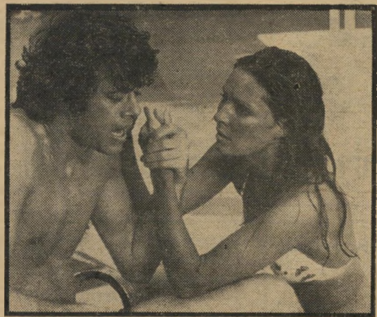
או'ניל וסאראזין - גילגולים מיותרים

הדרך שבה מובילים הבמאי והתסריטאי מאקס אהרליך (שעיבד סיפור מקורי משלו) את העלילה, משאירה מעט מאד ספקות לגבי מה שעומד לקרות, מאחר שהסיסטים הופכים, שיגרתית למדי, תחויות מדוייקות של המציאות. מאידך, מי שמצפה למצוא כאן רמזים דקים לתורת-