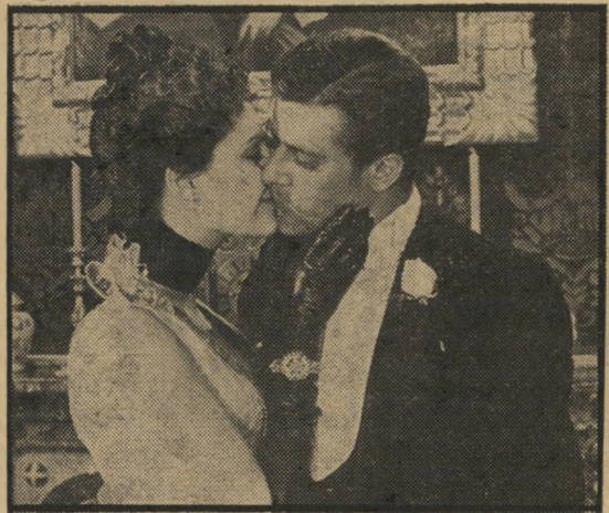
ג'יאנוני ואו'ניל - ניוון מיותר

אולם, מצד שני, סובל הסרט מכמה ליקויים תמוהים. למשל, חליהוק. ג'יאנקרלו ג'יאני וסטפאניה סאנדדלי, ש-