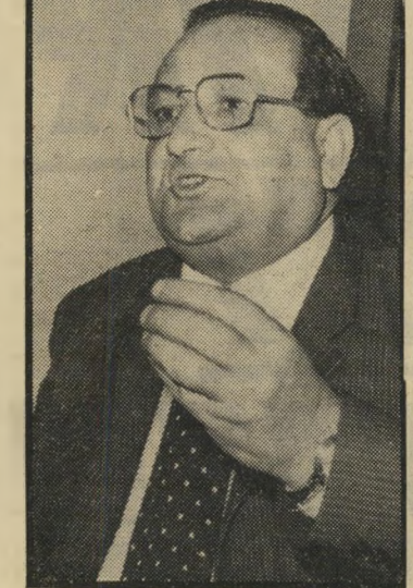
קודט גביש מענג סגור

השניים יצאו במכונית פרטית לנמל-התעופה בן-גוריון בלוד, שם נתן האל-מוני ללכטמן דרכון עם אשרת-כניסה ל-