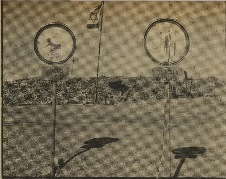
"הצעת לתמרורים" שז יעקב ספרי החיילים תפסו יוזמה