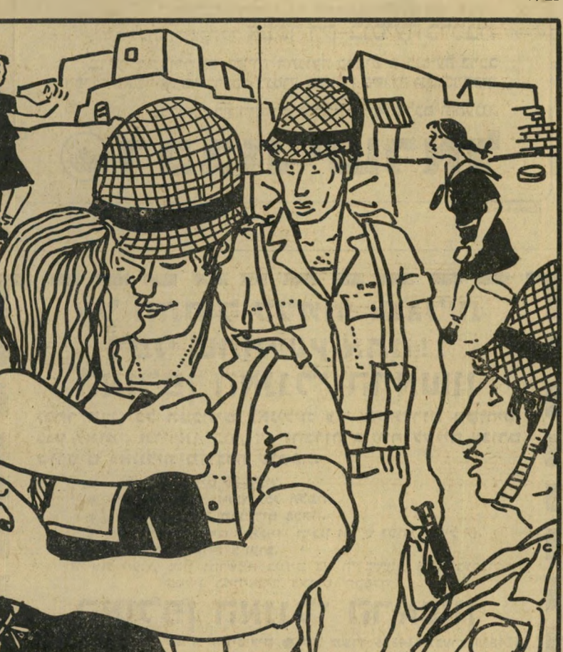
עבודי ואני הנחנו קרש על הגדר, ועלינו לצפות בנעשה מאחריה.

עבודי אמר לשים, כי לפני שמוציאים כסף צריך לחשוב על פיתרונות אחרים.