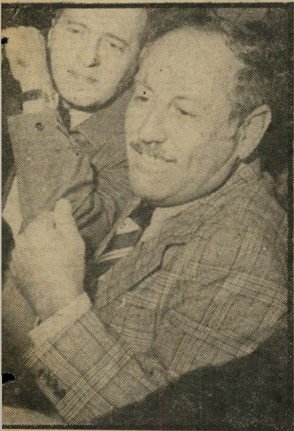
עסקן-ספורט דקין טינה אישית

יחר על כן, מערכות קובית-יחיאל הן מערכות הרהוט היחידות שהן מודולריות אמיתיות את מערכות קובית-יחיאל ניתן, בכל יום, לשנות, לרענן ולסדר מחדש - הכל כיד הדמיון הטובה עליך - בקלות וללא כל הוצאה נוספת!