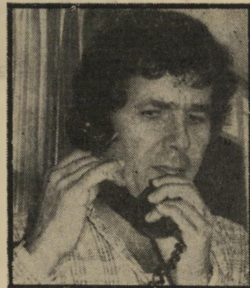
מבוקר דור האשמה שילוחית

עלמם של אלפי דולרים בעת כינוס הפועל במאי '75, מייחסים לו. כך, למשל, (זה לא מוזכר ב"דו"ח) הופיע ליליאן לטכניאנעילה של מרכז הפועל כשהוא נושא מיוזודה מלאה בדולרים לספורטאים-האורחים. הי מיוזודה נפתחה בטעות, דולרים רבים התפזרו על הארץ ואנשים שהיו בקירבת-