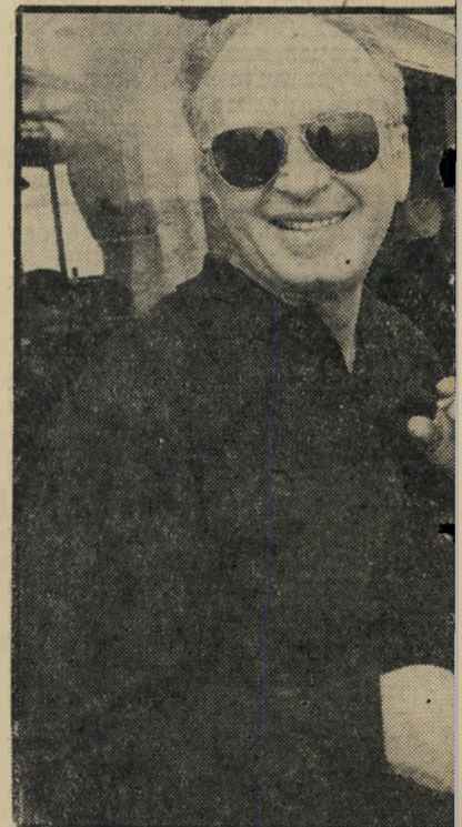
ים של מלון הסלע האדום באילת את ראש ילית בחופשה עם אשתו לאה. רבין נראה כי בשנייה. מאז אותה חופשה חדל לעשן זים בעיקבות שני התקפי-הלב שטברו עליו. תחחולים, בחברת הקריינית שוש עטרי.

א דא שאותו התקף-לב, שאמור היה להדליק אצל ינוקא אור אדום, לא הדליק אצלו כל אור שהוא. בהיותו בבית-החולים הוצף חדרו במבקרים, ונער כה לכבודו עלייה המונית לרגל ינוקא קיבל התקף-לב נוסף, והוא מספר: „זילי זלתי בעסק. איך שיצאתי מבית-החולים התחלתי להשתולל שוב, וחזרתי לאי-כיולב. ואז אמר לי אחד הרופאים: ינוקא, אם לא תשמע בקולנו לא תשמע יותר בחיים. ואת זה אני באמת לא אשכח. „סך-הכל, כשאני חושב עכשיו על מה שקרה לי, אני מבין שזה היה צריך לקרות. ניתלתי אור-חיים סוער, חייתי פעמיים. צריכים לחיות פעם אחת. לא צריך להגויס. אני חייתי בקצב-חיים מוגבר. אכזיב, אילת, פיאנו-באר, השתוללויות, בילויים עד שתיים בלילה. בית-החולים נתן לי חומר למחשבה, נעשיתי דתי, מאמין בכוח עליון, כל האמונות של הישארות הנשמה לאחר המוות תפסו אותי פיתאום.