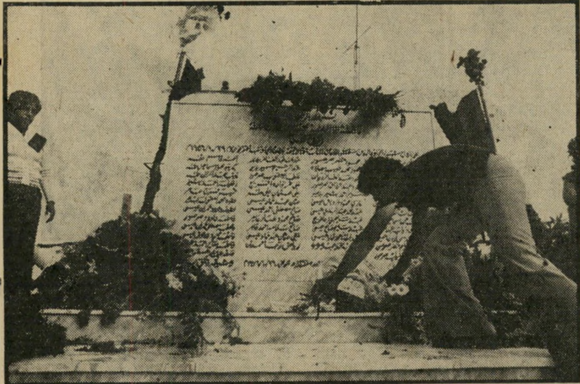
הסרת הציט מעץ אנדרטת-הזיכרון במקום הטבח שתי מילים — 49 הרוגים

נערה, ששיכלה ביום הרצח אה ואחות, נשאה ראשונה את דבריה המועזים —