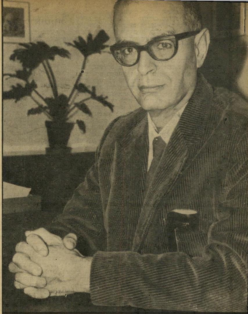
רקטור אוניברסיטת ת"א סימונסון עולים ויורדים

בירור קצר העלה, כי רק לפני חודשיים בוטלו מינויים אחדים בפקולטה למדעי-הרוח, ביניהם של מרצים בנושאי היהדות. לדיברי מרצה בפקולטה למדעי-הרוח, אין