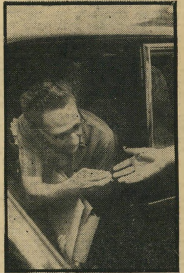
שר-החינוך ירדני מי ישרא?

"כוכב של המיפלגות." באחד מימי החודש האחרון נפגשו בלישכת השר בירושלים שניים מראשי התאחדות הסטודנטים דנטים, שני ראשי אוניברסיטאות וכמה פעילים מיפלגתיים, הפועלים במסגרת המיפלגות בקמפוסים של האוניברסיטאות השונות, והחליטו לפתור את בעיית איום השבחת הלימודים בדרך דיפלומטית. "ימים ספורים לפני הפגישה לא נותרה עוד ברירה בידי ראשי התאחדות הסטודנטים דנטים, הלחץ שהופעל בקמפוסים השונים היה גדול, וראש ההתאחדות, שרצו לש- מור על כיסאם, נאלצו להכריז: "אם לא יימצא פיתרון, תהיה שבייתה!" מייד אחרי הפירסום הורצו שיחות-טלפון